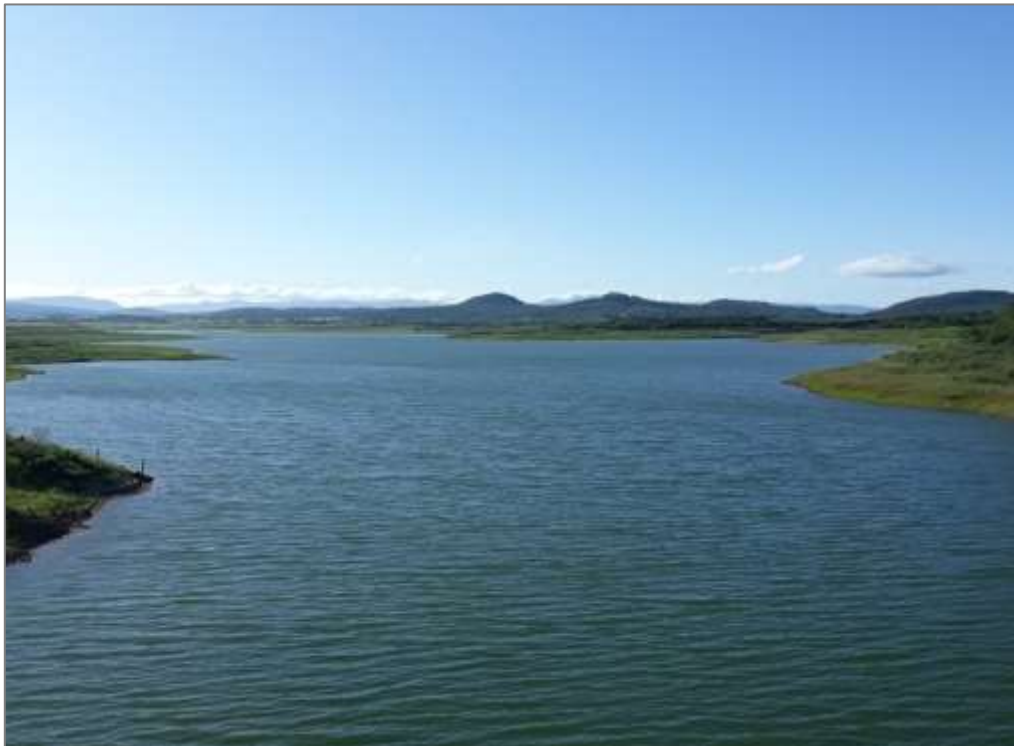
Figura 3: Reservatório Cova de Mandioca, município de Urandi (BA), Alto Verde Pequeno.