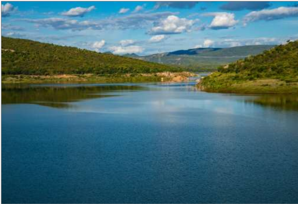
Figura 2: Reservatório Bico da Pedra, município de Janaúba (MG), Alto Gorutuba.