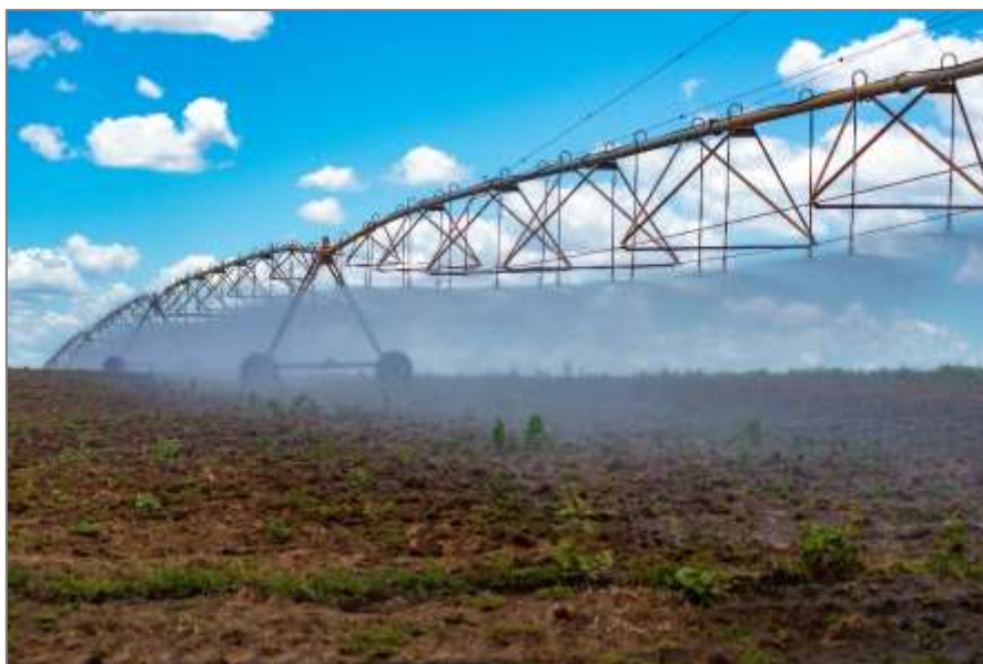
Figura 1: Pivô de irrigação, Fazenda Rio Verde, município de Verdelândia (MG), Médio Verde Grande - Trecho Baixo.

A principal atividade econômica da bacia do rio Verde Grande é a produção agrícola, na qual estão implantados três Perímetros Públicos de Irrigação: Perímetro Gorutuba, Perímetro Lagoa Grande e Perímetro Estreito. Juntos, os perímetros possuem uma área irrigável de aproximadamente 14 mil hectares, configurando grandes polos da fruticultura irrigada, com destaque para o cultivo da banana, manga, mamão, maracujá e uva (Figura 1).