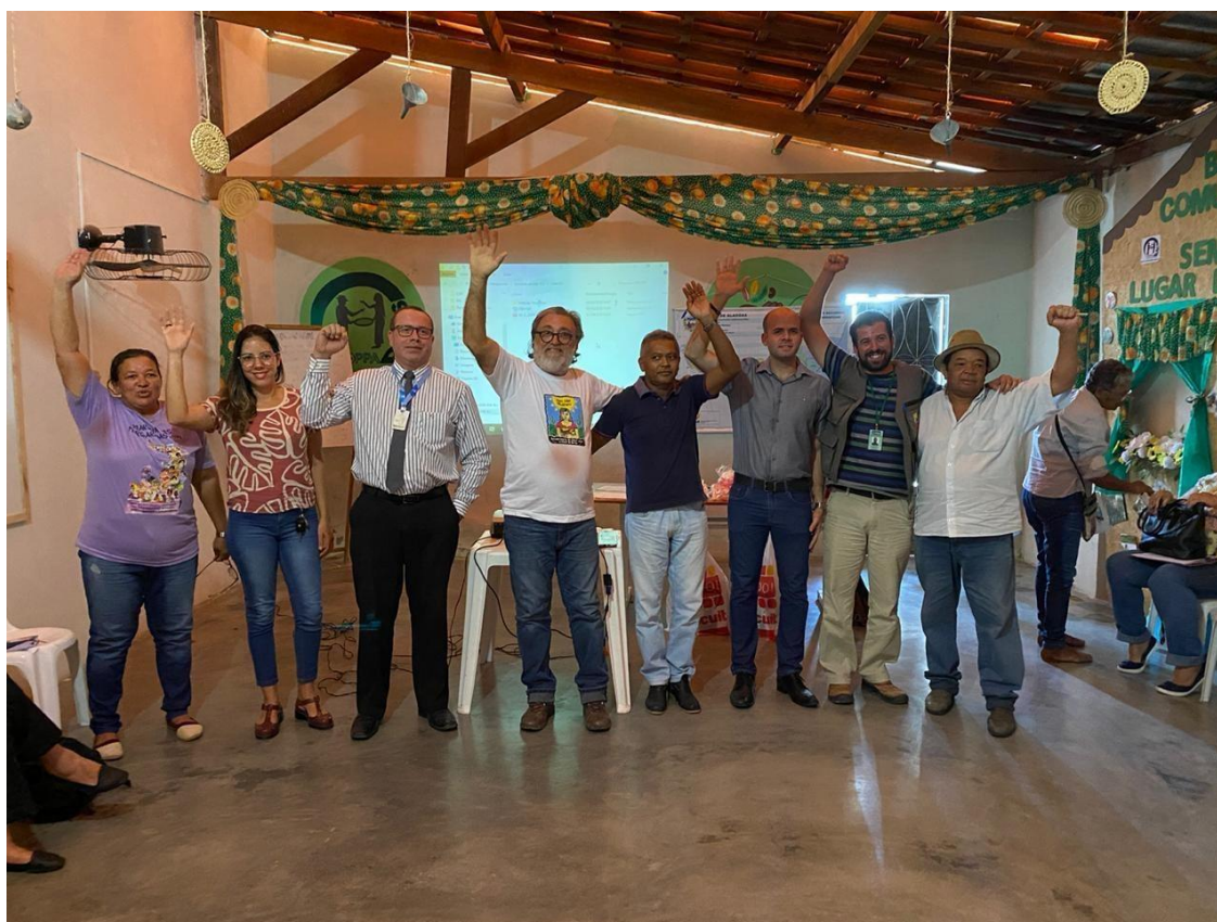
Figura 2 – Representantes das instituições eleitas para a Comissão Provisória.

De acordo com o Art. 8º, a proposta de criação de comitê poderá ser encaminhada à consideração do Conselho Estadual de Recursos Hídricos - CERH pela Comissão Provisória citada no Art. 3º, quando subscrita por no mínimo três órgãos, entidades ou instituições legalmente constituídas, reconhecidas como representativas de diferentes setores usuários de recursos hídricos da bacia ou por 1/3 das Prefeituras Municipais inseridas na bacia.