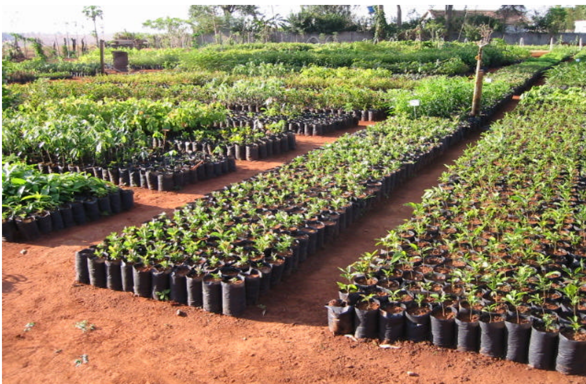
Foto 8. Viveiro de Mudanças de Essências Nativas.

As mudas produzidas se destinam à recuperação das matas ciliares do rio São Francisco e seus afluentes, no âmbito do município, e implantação de áreas de florestas, para fins econômicos. As mudas foram produzidas basicamente no viveiro de mudas da prefeitura municipal, que possui um espaço com capacidade para produção de até 200.000 mudas.