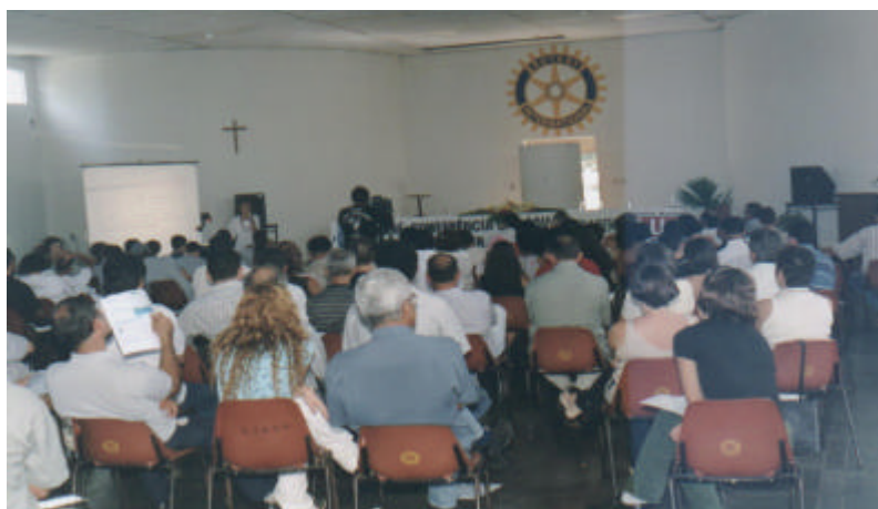
Foto 3. Reunião com todos os segmentos da sociedade

A metodologia para a mobilização e capacitação foi a da educação ambiental popular, que