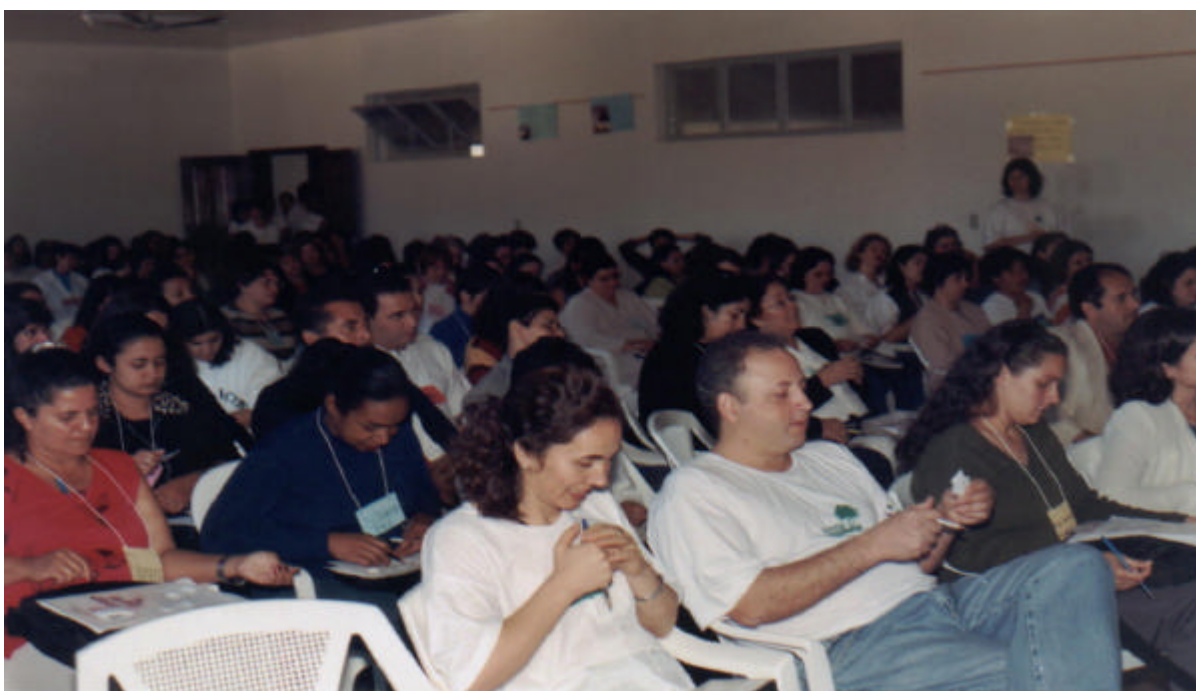
Foto 6. Participantes do Repasse do Curso

Os contatos foram feitos, e depois de aprovado o programa pela Secretaria de Educação e Superintendência de Ensino, foi realizado o repasse para 275 servidores do ensino, em dois dias. O trabalho foi um sucesso e contou com toda a equipe, que participou ativamente em todos os momentos.