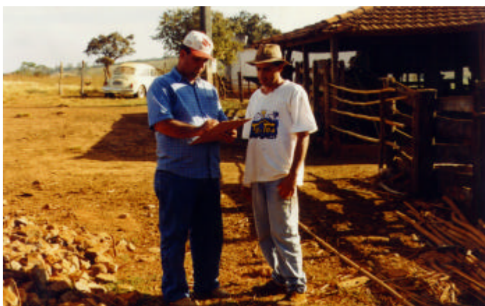
Foto 2. Cadastramento do Produtor Rural no Município de Luz.

A zona rural do município está dividida em várias comunidades distantes umas das outras. Por causa desta grande extensão, a atividade de cadastramento se constituiu no passo inicial das