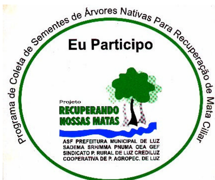
Figura 2. Símbolo da Campanha de Coleta de Sementes

No momento do cadastro, algumas parcerias foram firmadas com aqueles produtores que se mostraram mais sensibilizados com as atividades do projeto. Cabe destacar que alguns produtores, ao verem o termo do convênio, preferiram não assinar, temendo serem penalizados por qualquer razão. Por causa disto, alguns produtores receberam mudas sem assinar convênio, pois estavam desejosos de participar, mas sem assinar o documento, seja por receio, fruto da falta de instrução e/ou confiança.