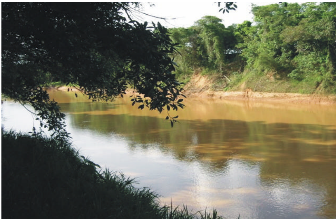
Foto 7. Mata Ciliar do Rio São Francisco Município de Luz

A cobertura vegetal nativa em Minas Gerais foi dizimada pelas atividades agropecuárias e principalmente pela siderurgia. Em se tratando das matas ciliares, em especial da bacia do Rio São Francisco, a degradação chegou a ponto de levar muitas espécies quase à sua completa extinção. Para muitas dessas espécies, não se encontram exemplares que servem de matrizes para sua reprodução. Necessário se faz buscar sementes em locais muitas vezes distantes, em parques florestais e/ou em outras reservas. Estas dificuldades prejudicam a qualidade do trabalho desenvolvido.