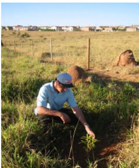
Foto 9. Plantio de Muda Nativa

A recomposição das matas ciliares foi feita com base em uma parceria entre o Subprojeto e o produtor rural. O Subprojeto oferecia além da assistência técnica e acompanhamento das atividades, insumos para o isolamento (moirão) da área a ser recuperada, as mudas adequadas e formicida para o controle de formigas.