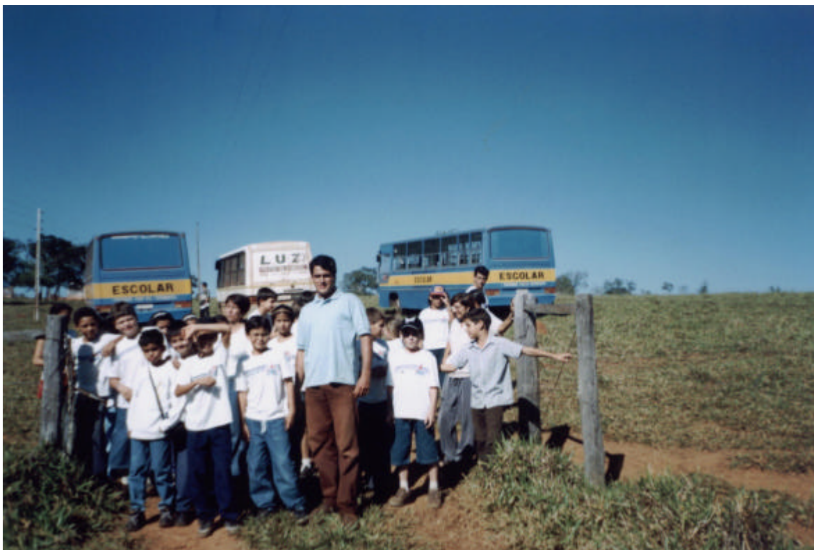
Foto 10. Alunos Durante o Mutirão de Plantio

Os alunos tiveram todo o período disponível para o trabalho, correspondendo a uma aula de campo que antecedeu o plantio.