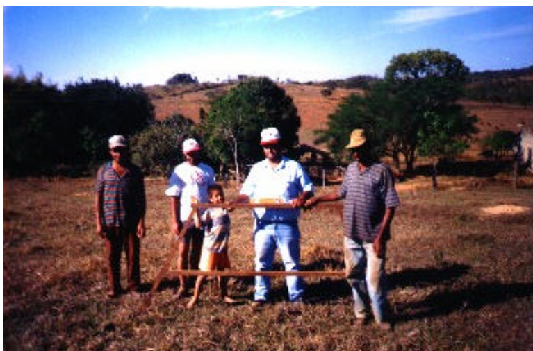
Foto 5. Treinamento para Demarcação de Curva de Nível, Utilizando Pé-de-Galinha

Exemplos bem sucedidos da utilização de terraços em curvas de nível permitiram o conhecimento sobre os benefícios decorrentes dessas práticas.