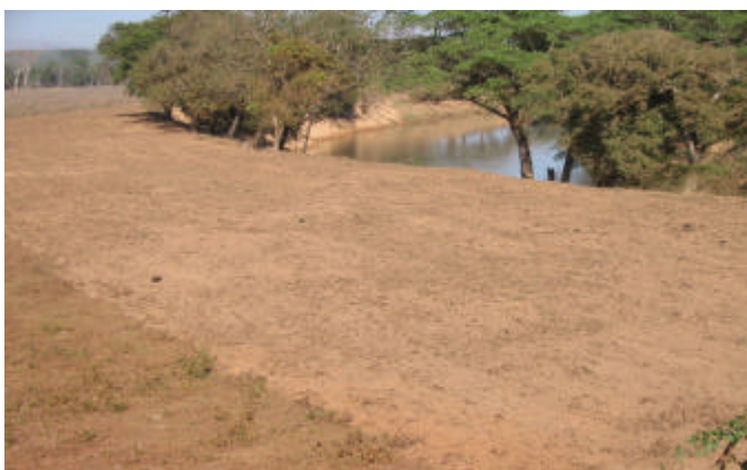
Foto 1. Área Degrada à Margem do Rio São Francisco

Em se tratando das matas ciliares da bacia do Rio São Francisco, a degradação chegou a ponto de levar muitas espécies quase à sua completa extinção. Para muitas destas espécies, não se