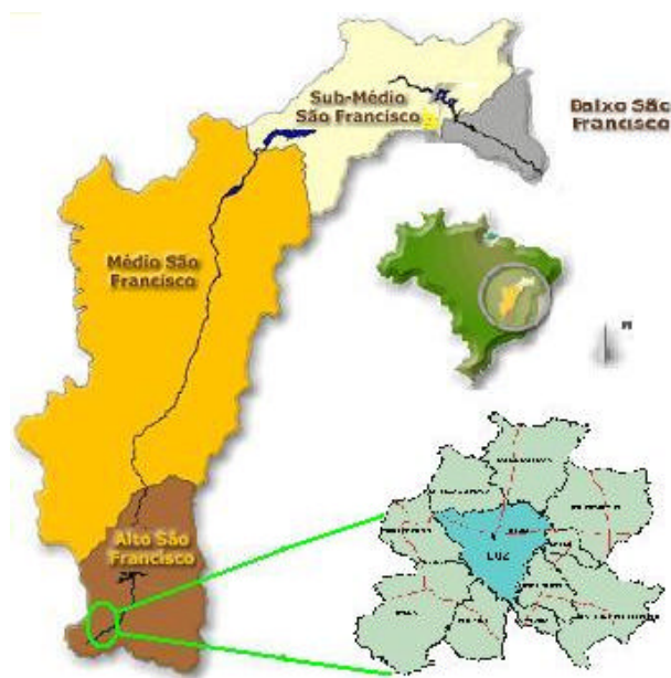
Figura 1. Localização do Município de Luz

Este relatório final do subprojeto 2.2.B descreve as atividades relacionadas à mobilização e Capacitação da comunidade de Luz, a implementação de prática de conservação de solos e a produção de mudas de espécies florestais para recuperação de matas ciliares e formação de florestas econômicas. O Subprojeto 2.2.B – Recuperando Nossas Matas, é parte do componente II do Projeto de Gerenciamento Integrado das Atividades Desenvolvidas em Terra na Bacia do São Francisco (ANA/GEF/PNUMA/OEA), executado no município de Luz/MG.