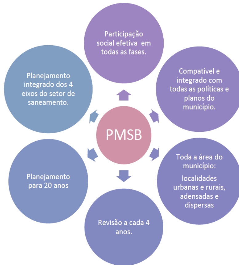
Figura 1 – Considerações gerais sobre a elaboração de PMSB