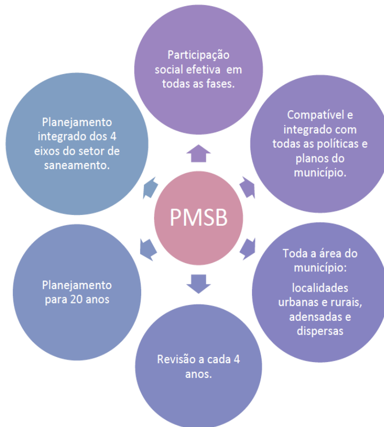
Figura 1 – Considerações gerais sobre a elaboração de PMSB