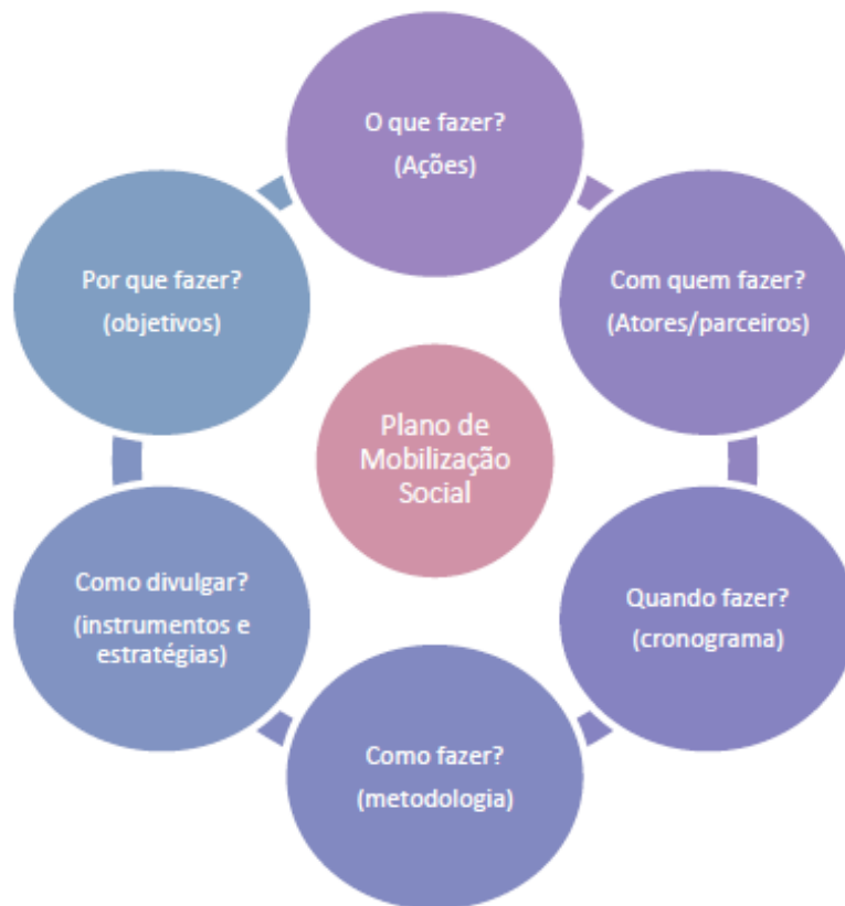
Figura 3 – Foco de atuação do Plano de Mobilização Social de um PMSB.