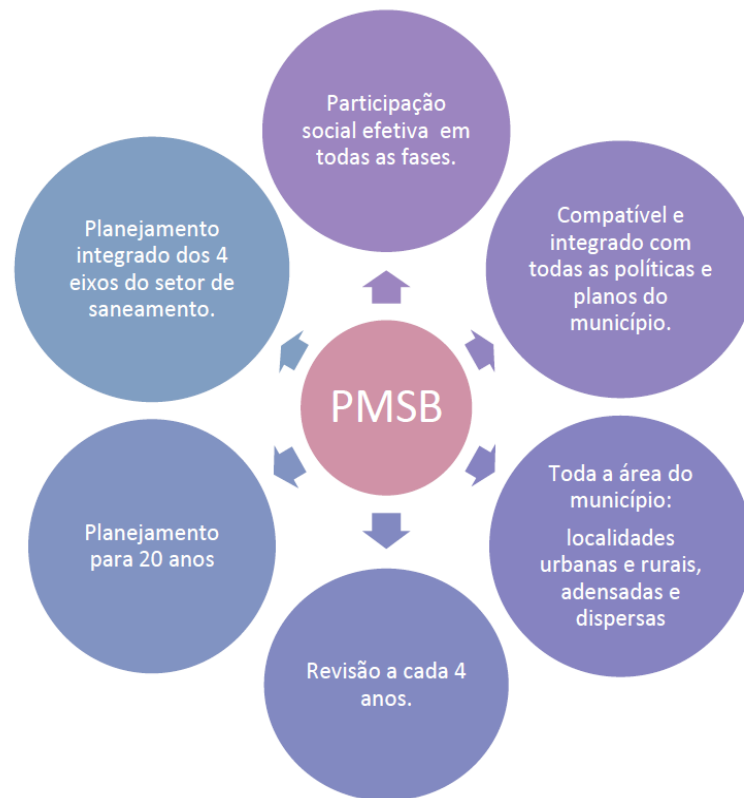
Figura 2 - Considerações gerais sobre a elaboração de PMSB

A Figura 2, extraída do “Termo de Referência para Elaboração de Planos Municipais de Saneamento Básico” da FUNASA, ilustra uma orientação de como a PREFEITURA MUNICIPAL deverá desenvolver seus trabalhos objetivando a aprovar o seu Plano Municipal de Saneamento Básico.