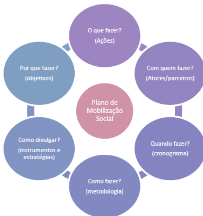
Figura 3 - Foco de atuação do Plano de Mobilização Social de um PMSB