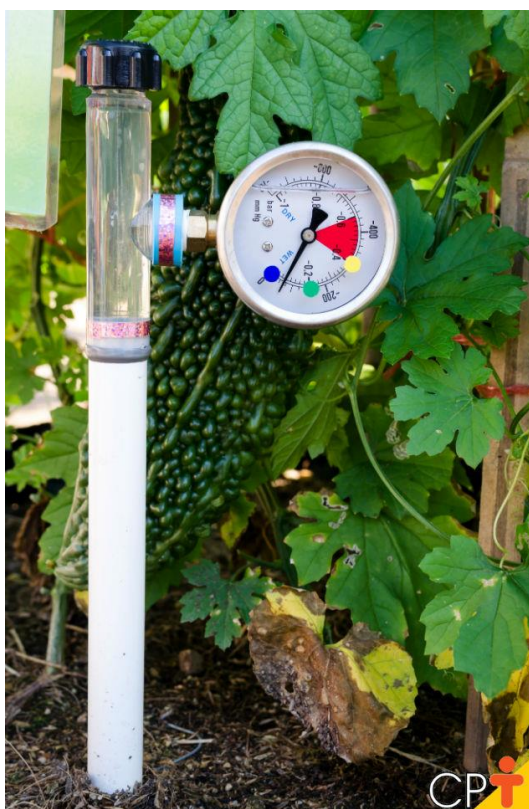
Figura 1 – Tensiômetro com vacuômetro.

Na Figura 1 é ilustrado um tensiômetro com vacuômetro empregado no manejo da irrigação.