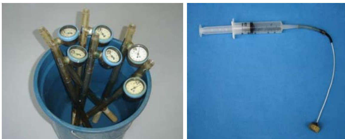
Figura 3 - Processo de saturação de tensiômetros previamente à instalação.

v) quando o vacuômetro indicar pelo menos 50 kPa, submergir a cápsula em água. Caso a leitura não caia rapidamente na faixa entre 0 e 5 kPa, o tensiômetro deve ser revisado para eliminar possíveis problemas de entrada de ar e ser testado novamente.