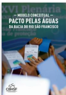
Pacto pelas Águas da Bacia do Rio São

4.1.2. Projeto Gráfico: o projeto gráfico deverá seguir o padrão de design da capa, lombada e verso da proposta da imagem abaixo (volumes da Coleção Velho Chico), considerando que se trata de continuidade da mesma Coleção. As informações relativas à formatação serão encaminhadas pela CONTRATANTE.