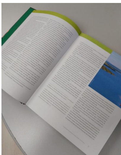
Imagens do livro: capa e miolo