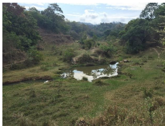
Figura 1 - Curso d'água sem mata ciliar