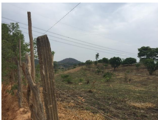
Figura 2 - Área de pastagem

De forma geral, a vegetação da área é predominantemente de transição e cerrado, sendo visualizados trechos de áreas de pastagens nessa localidade (IDE-SISEMA, 2020). A ocupação característica nesse trecho é essencialmente rural, e atividades agropecuárias são identificadas na localidade (Figura 2). Ao redor da APA percebe-se a presença de loteamentos irregulares que causaram muitos problemas em Ribeirão das Neves e deixaram o solo exposto a vários tipos de erosões. As intervenções antrópicas desordenadas em pontos elevados, com declives acentuados e em planícies de inundação expõem o solo e/ou o impermeabiliza comprometendo a infiltração, ocasionando eventuais transbordamentos e alagamentos de vias. Cursos d'água degradados podem ser visualizados na região Figura 1. A área de atuação pode ser visualizada na Figura 3.