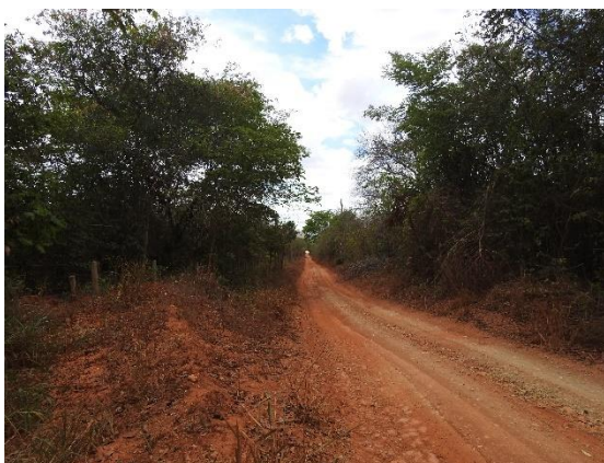
Figura 1 - Remanescente de Cerrado

A paisagem da APA foi alterada por pastagens e plantios e a vegetação remanescente consiste em cerrado, cerradão e mata seca. Em visita a campo, foi possível notar alguns pontos com representativos fragmentos de cerradão (Figura 1) e a presença de eucalipto; a escassez hídrica na região central da APA e a degradação de alguns corpos d'água (Figura 2) evidenciam a necessidade de consolidação do planejamento para a APA. A área de atuação segue representada na Figura 3.