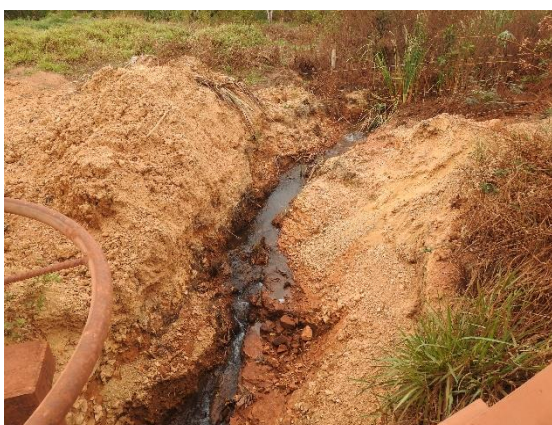
Figura 2 - Rio Picão próximo à fazenda Saco Preto