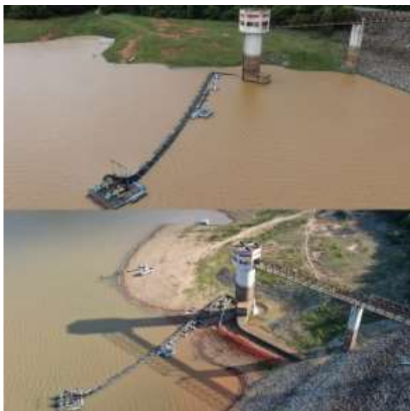
Comparativo entre janeiro de 2020 e dezembro de 2019

De acordo com a COPASA, a barragem de Juramento, uma das fontes de abastecimento de Montes Claros/MG, está com 34,63% da capacidade de armazenamento. O nível mais alto registrado em 2019 foi de 33,75%. Saiba mais .