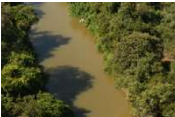
Trecho do rio Verde Grande, município de Jaíba/MG.

A Agência Nacional de Águas (ANA) irá promover nos dias 03, 04, 05 e 06 de fevereiro uma Campanha de Regularização de Usos do rio Verde Grande. Clique aqui e se informe sobre a programação.