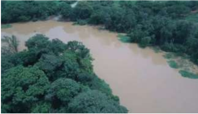
Trecho do rio Verde Grande, município de Matias Cardoso/MG

A Agência Nacional de Águas (ANA) decidiu prorrogar os prazos de condicionantes e vigências de outorgas de direito de uso de recursos hídricos, das outorgas preventivas e das Declarações de Reserva de Disponibilidade Hídrica (DRDHs) até 31 de dezembro de 2020. A medida visa minimizar os impactos econômicos nos setores produtivos durante o atual contexto de pandemia do novo coronavírus (COVID-19). Para acessar a matéria na íntegra, clique aqui .