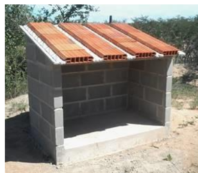
Figura 2 – Abrigo em fase final de construção

A figura 1 representa o projeto de um dos abrigos em perspectiva frontal direita, e a figura 2 apresenta um abrigo em fase final de construção.