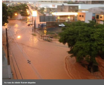
As ruas de casado ficaram alagadas