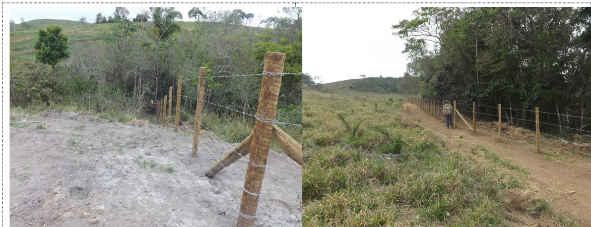
Figura 17 - Acervo fotográfico do projeto de recuperação hidroambiental da bacia do rio Bananeiras.