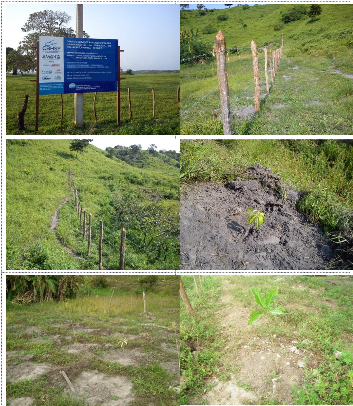
Figura 24 - Acervo fotográfico do projeto de recuperação hidroambiental na bacia do rio Jacaré.