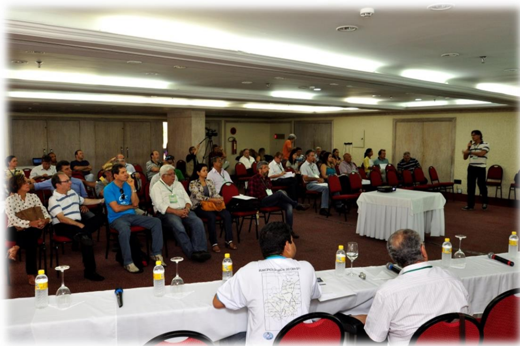
Figura 4 - Imagem da XXIV Reunião Plenária Ordinária e XV Reunião Plenária Extraordinária do CBHSF