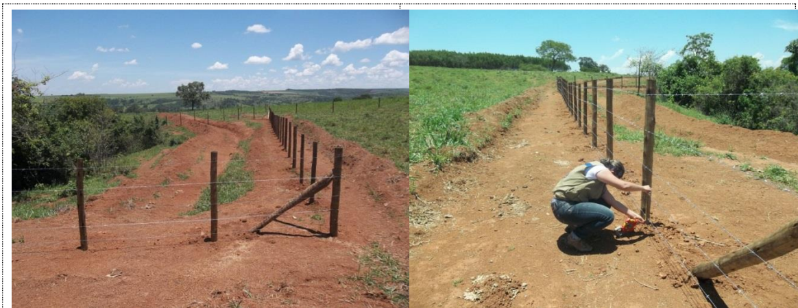
Figura 17 - Acervo fotográfico do projeto de recuperação hidroambiental da bacia do rio Santana.