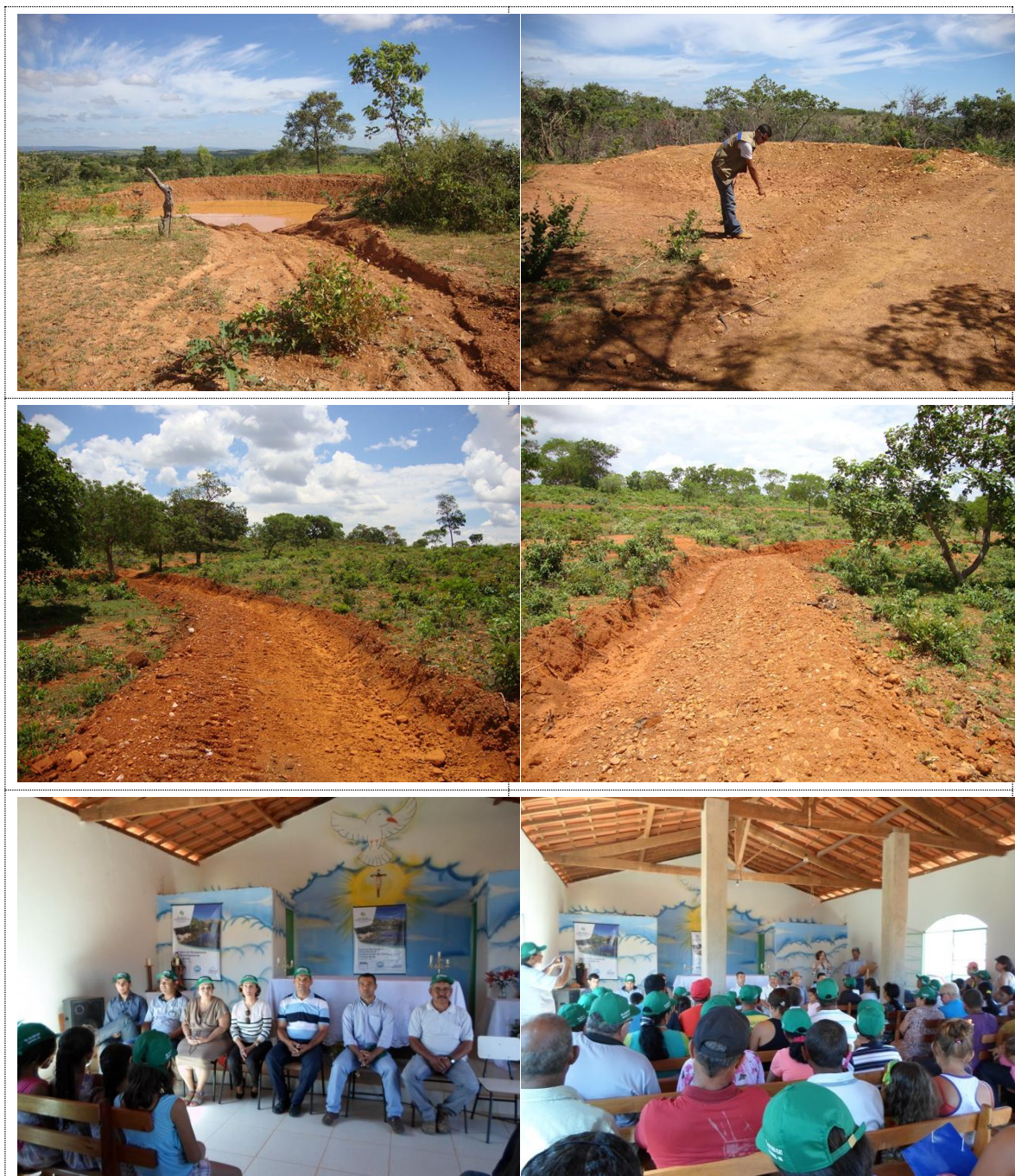
Figura 11 - Acervo fotográfico do projeto de recuperação hidroambiental da bacia do rio das Pedras e córrego Buritis.