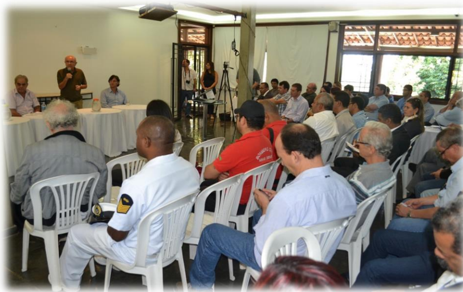
Figura 5 - Imagem das Oficinas de Usos Múltiplos do Rio São Francisco