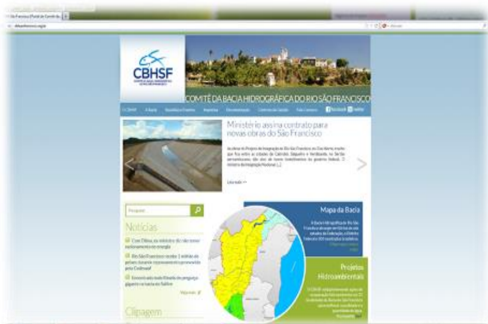
Figura 7 - Imagem do site do CBHSF

A empresa contratada pelo processo de dispensa de licitação nº 08/2011 foi a IBODY - Agência Interativa Ltda. - ME, por meio do Contrato nº 21/2011. Este Contrato foi firmado no dia 06 de dezembro de 2011. Após a elaboração do website , a empresa contratada para executar o Plano de Comunicação do Comitê, a CDLJ Publicidade, ficou responsável pela atualização das notícias e manutenção do site.