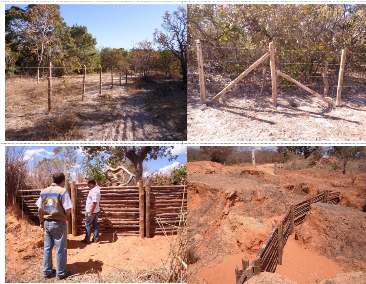
Figura 18 - Acervo fotográfico do projeto de recuperação hidroambiental da bacia do rio Itaguari.