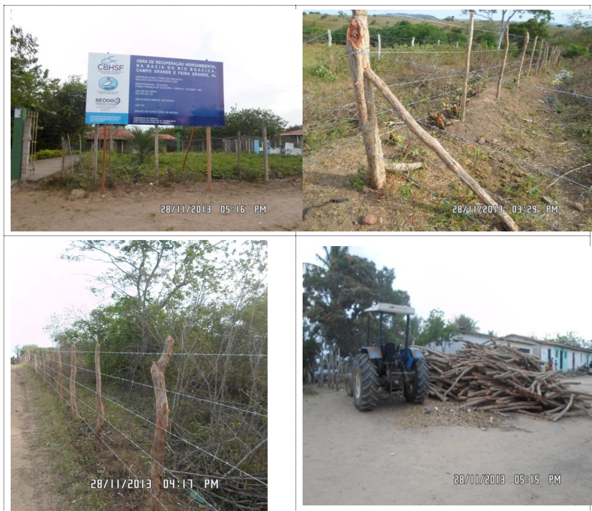
Figura 25 - Acervo fotográfico do projeto de recuperação hidroambiental na bacia do rio Boacica.

Na Figura 25 são apresentadas fotografias que ilustram as intervenções executadas, assim como a interação dos beneficiados pelo projeto em uma das atividades de mobilização social.