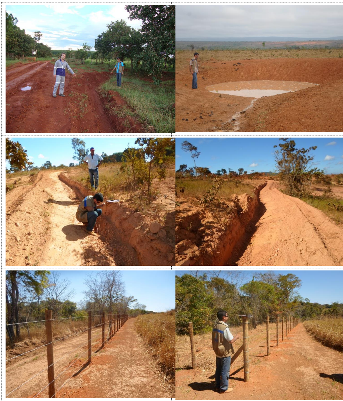
Figura 15 - Acervo fotográfico do projeto de recuperação hidroambiental do entorno da represa de Três Marias.