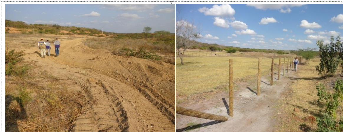
Figura 23 - Acervo fotográfico do projeto de recuperação hidroambiental da nascente do rio Pajeú.