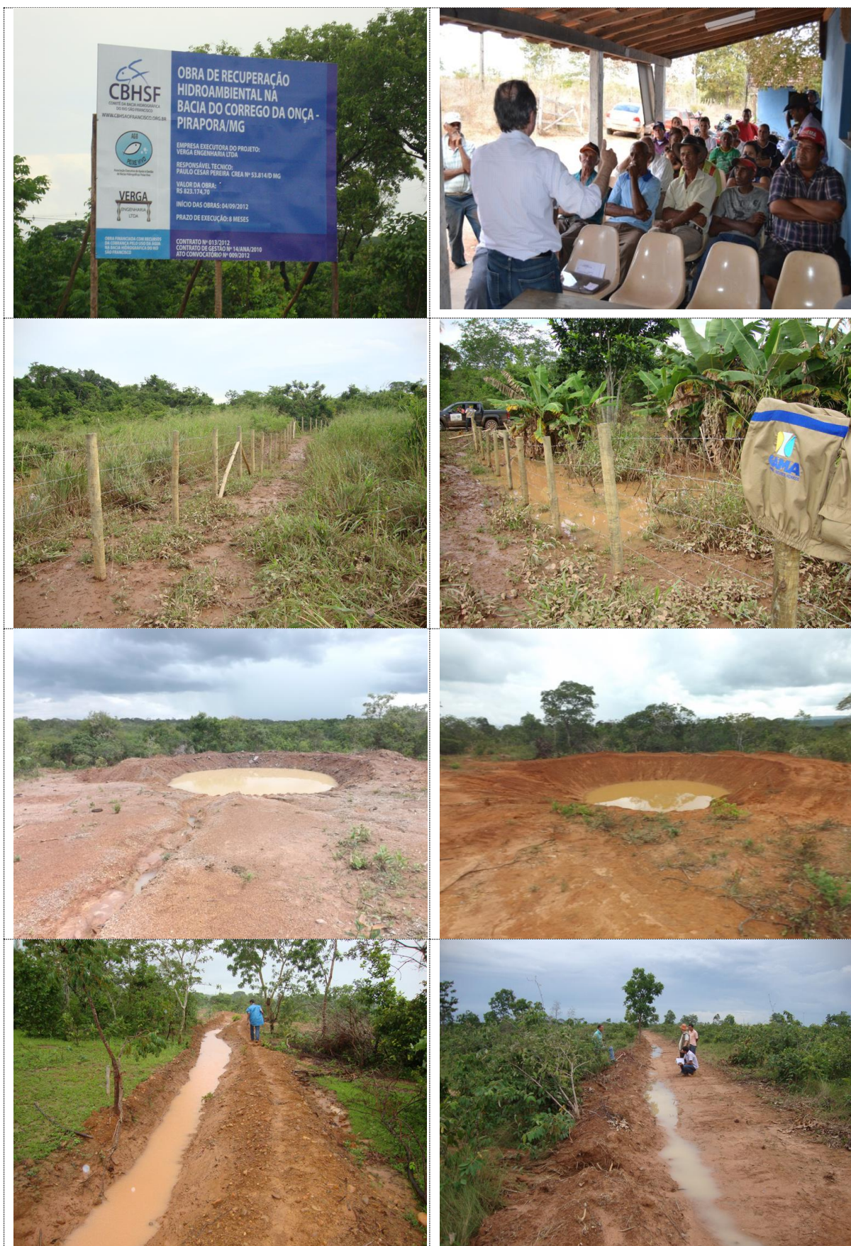
Figura 12 - Acervo fotográfico do projeto de recuperação hidroambiental da bacia do córrego da Onça.