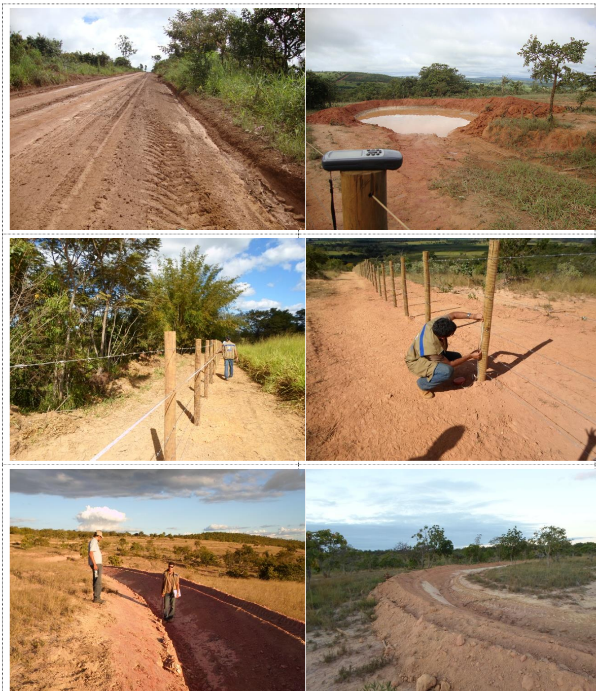
Figura 14 - Acervo fotográfico do projeto de recuperação hidroambiental da bacia do ribeirão Canabrava.