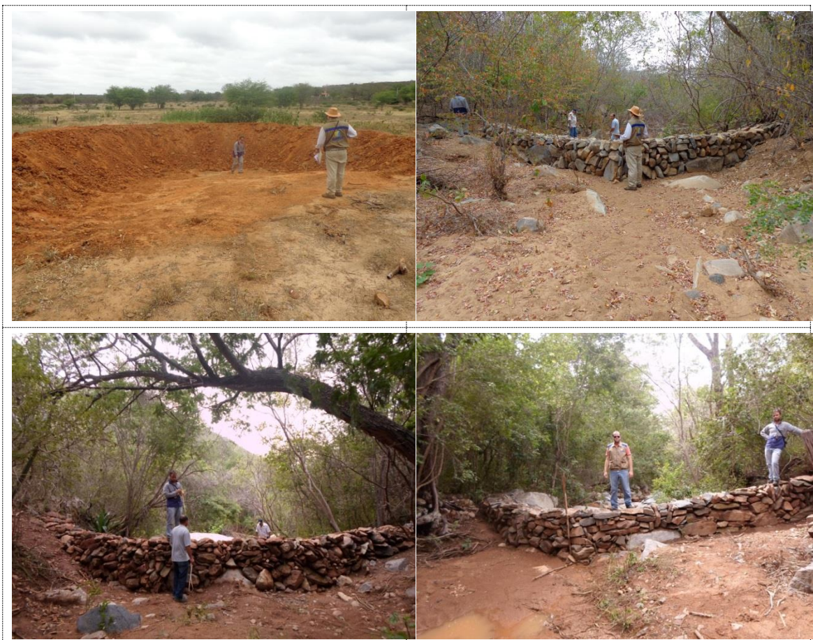
Figura 22 - Acervo fotográfico do projeto de recuperação hidroambiental da bacia do córrego Onça.