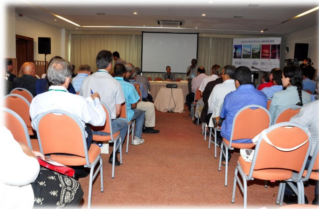
Figura 3 - Imagem da XXIII, XIV Reunião Plenária ordinária e extraordinária do CBHSF