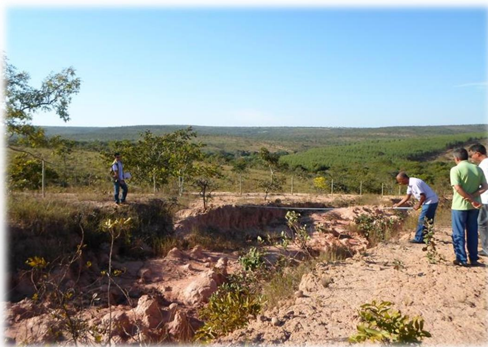
Figura 9 - Técnicos da GAMA Engenharia realizando inspeção em campo para elaborar projeto de contenção de processo erosivo, Felixlândia - MG.