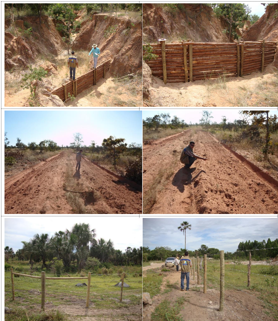
Figura 13 - Acervo fotográfico do projeto de recuperação hidroambiental da bacia do rio Jatobá.