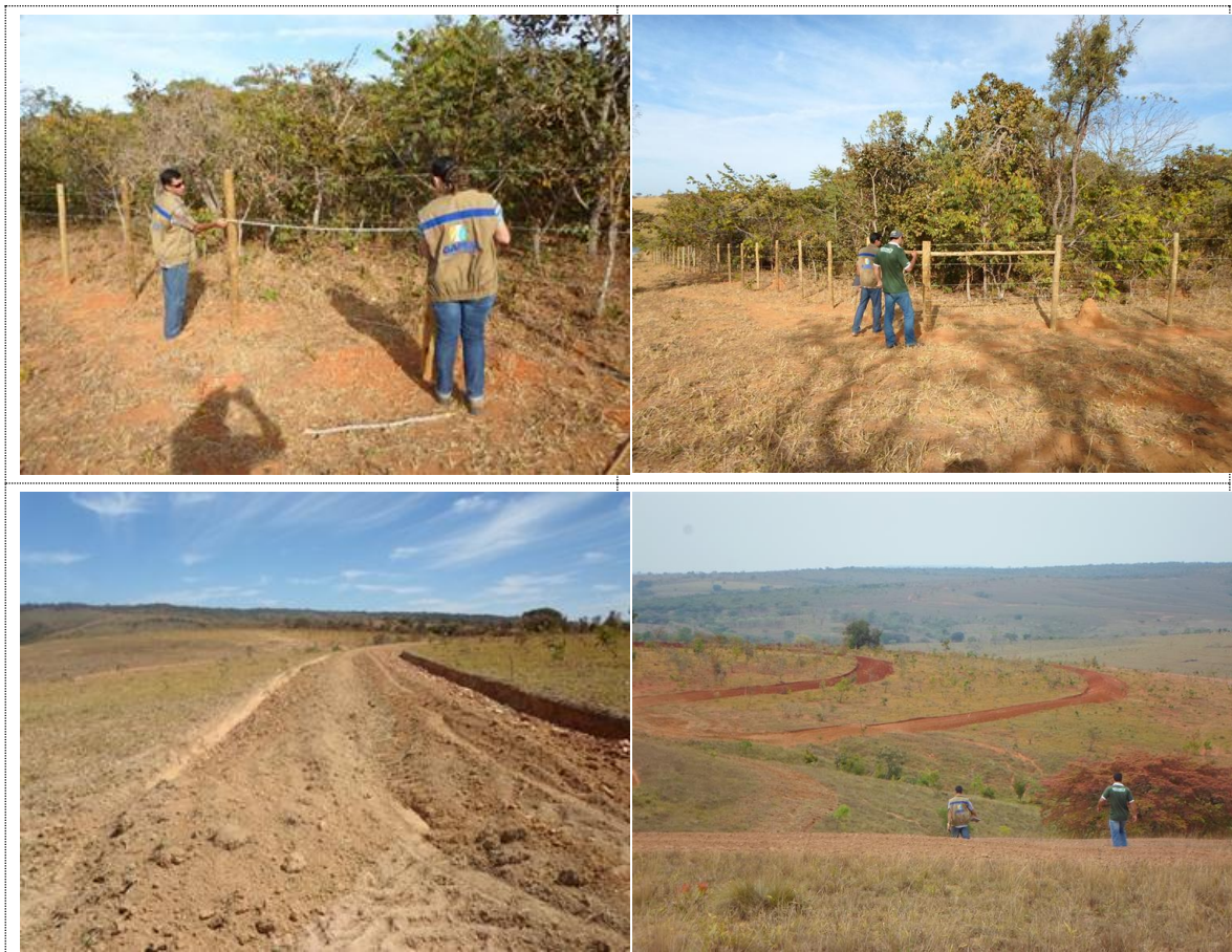
Figura 16 - Acervo fotográfico do projeto de recuperação hidroambiental da bacia do ribeirão São Pedro.