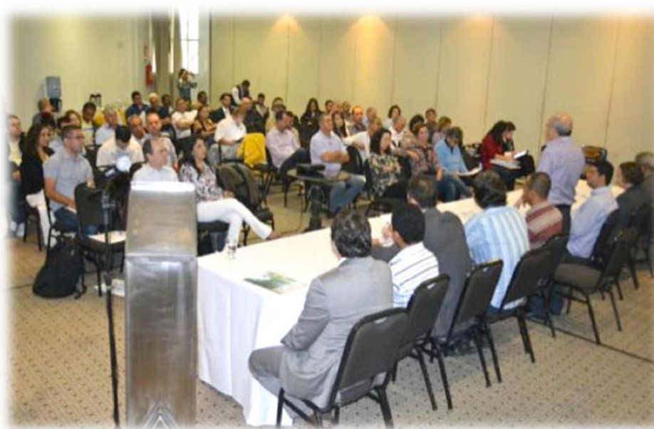
Figura 6 - Imagem das do I Encontro dos Afluentes

No dia 17 de julho de 2013, reuniram-se no Hotel San Diego, em Belo Horizonte- MG, participaram os Comitês afluentes da bacia do rio São Francisco, com apresentação do pacto das águas, revisão do plano decenal, estudos sobre os aquíferos Urucua e Bambui e ainda criação de uma agenda comum entre o CBHSF e os comitês afluentes.