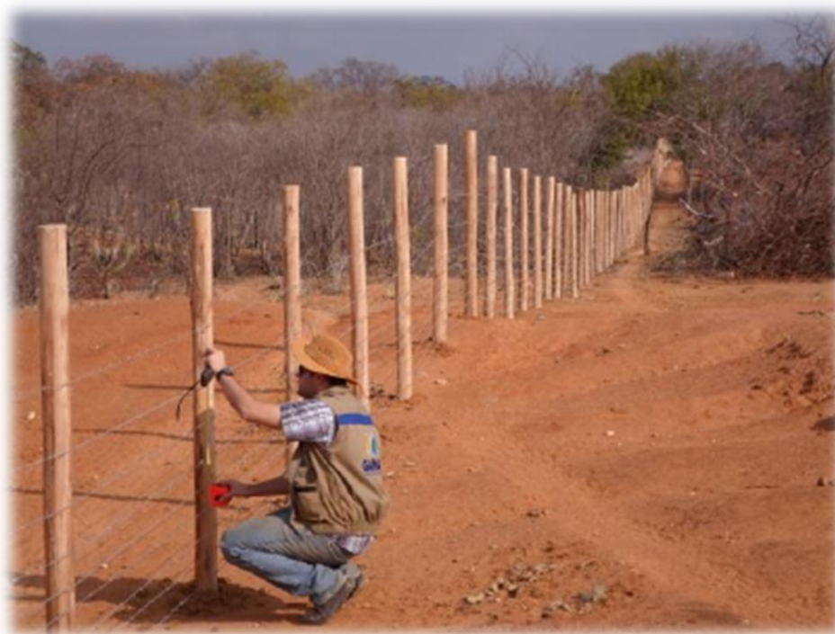
Figura 8 - Medição de serviço de cercamento de área protegida, Curaçá - BA.