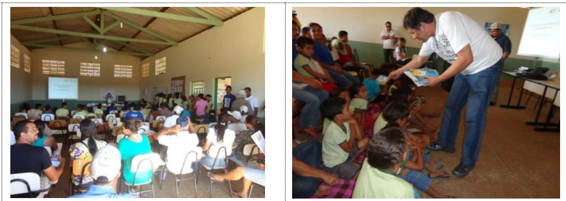
Figura 20 - Acervo fotográfico do projeto de recuperação hidroambiental da bacia do rio Salitre.