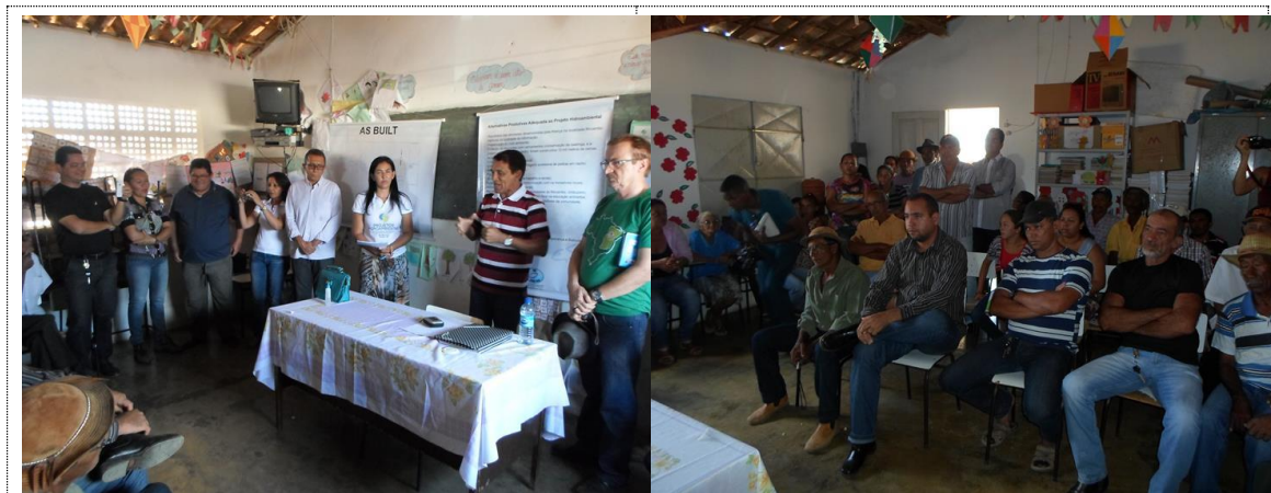
Figura 21 - Acervo fotográfico do projeto de recuperação hidroambiental da bacia do rio Mocambo.