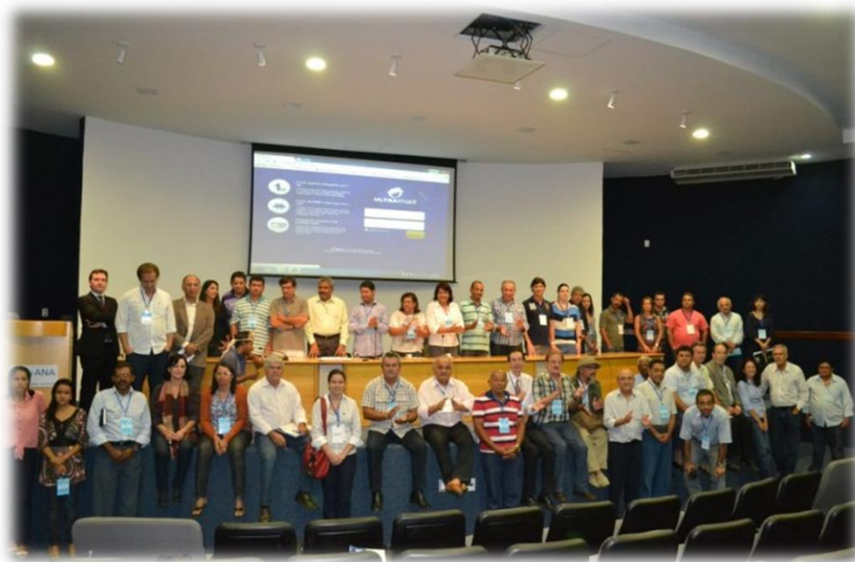
Figura 2 - Imagem da XIII Reunião Plenária Extraordinária do CBHSF