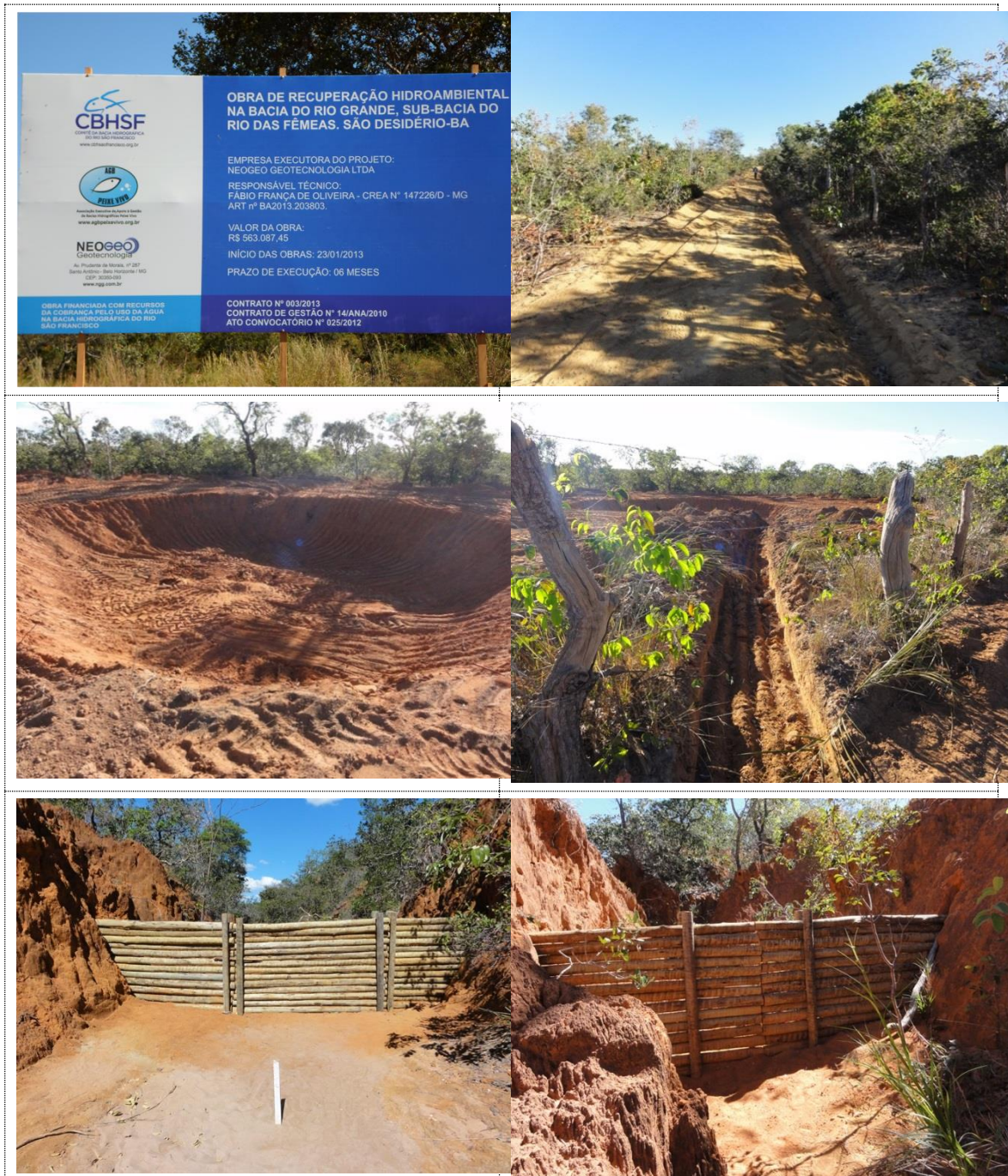
Figura 19 - Acervo fotográfico do projeto de recuperação hidroambiental da bacia do rio das Fêmeas.

Na Figura 19 são apresentadas fotografias que ilustram as intervenções executadas.