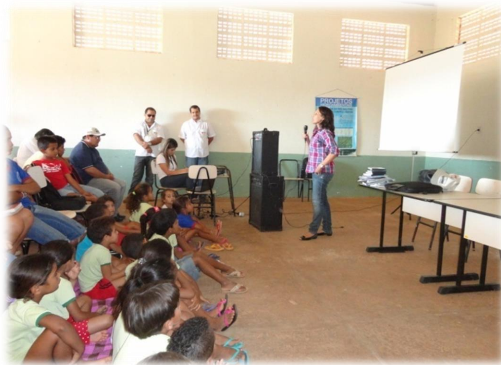
Figura 10 - Acompanhamento técnico da GAMA Engenharia em uma reunião de mobilização social em um projeto hidroambiental em Morro do Chapéu, Bahia. Fonte: GAMA Engenharia / AGB Peixe Vivo, 2013.