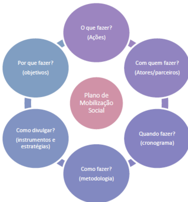
Figura 3 – Foco de atuação do Plano de Mobilização Social de um PMSB.