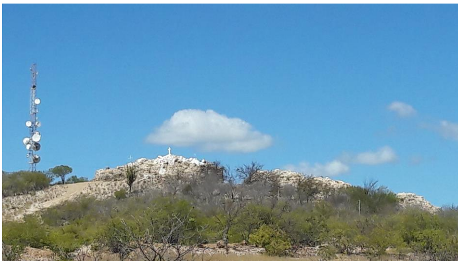
Figura 4 - Local de instalação da ETA compacta.