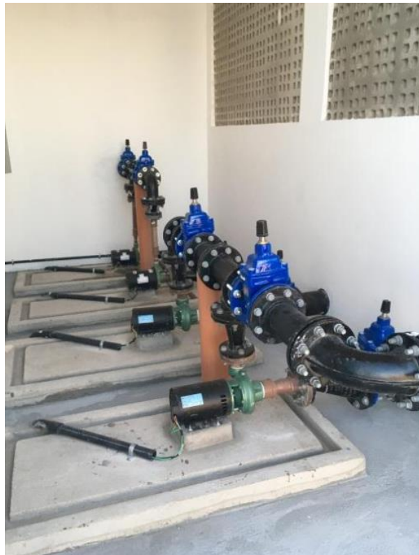
Figura 7 - Bateria de conjuntos motobomba da ETA compacta (já instalados).