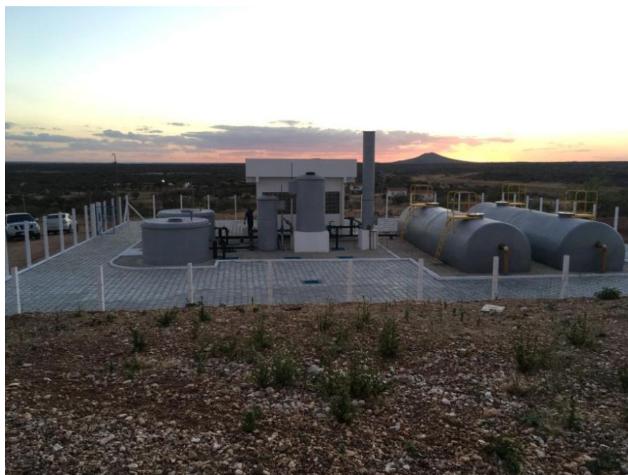
Figura 9 - Visão geral da ETA compacta (já instalada).