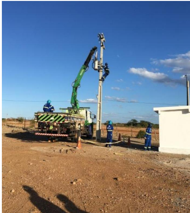
Figura 6 - Momento da instalação da rede elétrica para atendimento ao quadro de comando da captação flutuante (380V).