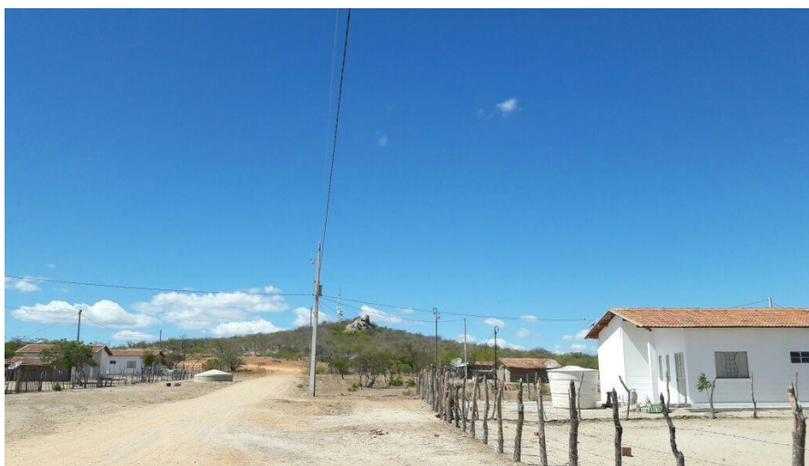
Figura 2 - Rua principal da Aldeia Serrote dos Campos (Pankará).