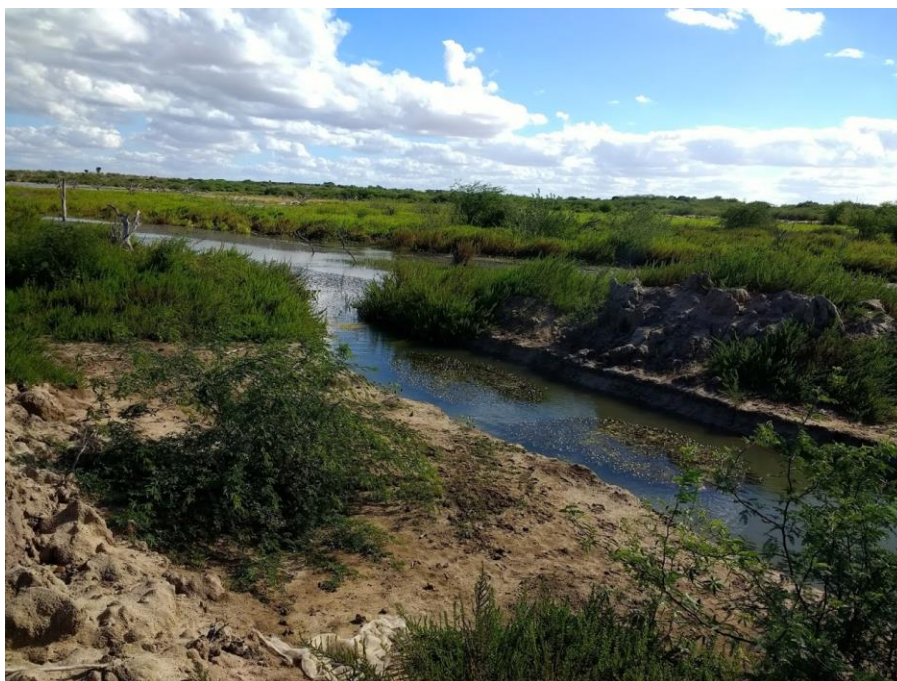
Figura 8 - Local onde será implantada a captação flutuante (lago de Itaparica - rio São Francisco).