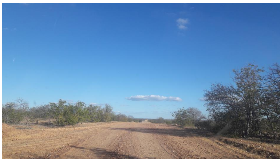
Figura 5 - Estrada para acesso a captação flutuante a partir da Aldeia Pankará.