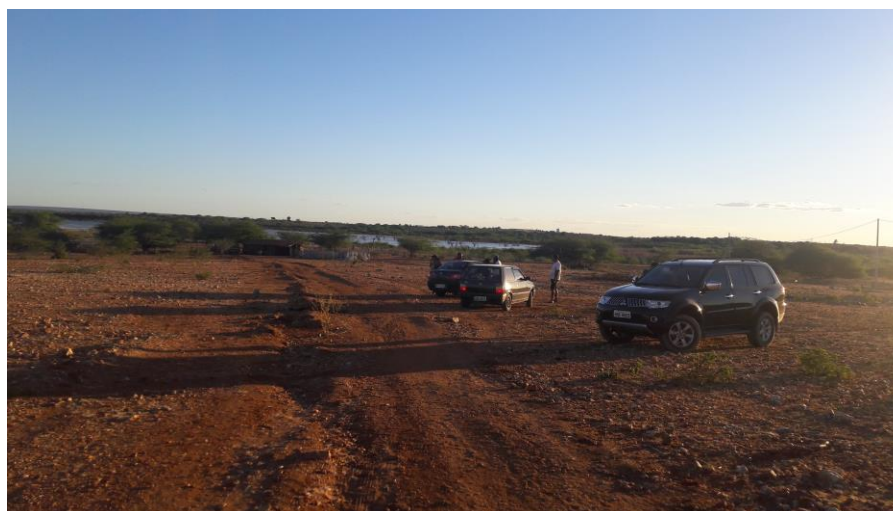
Figura 3 - Local para instalação do quadro de comando da captação flutuante.