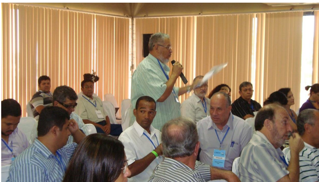
Figura 6 – Público presente aos debates na XVIII Reunião Ordinária Plenária do CBHSF