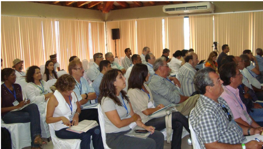
Figura 7 – Público presente às apresentações da XVIII Reunião Plenária Ordinária do CBHSF