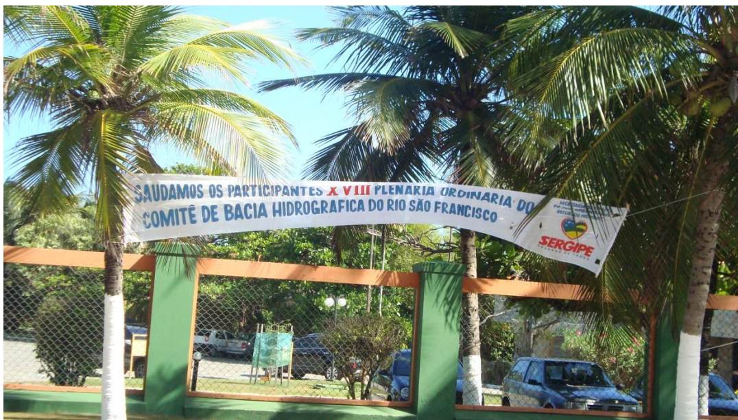
Figura 5 – Local da realização das Reuniões Plenárias do CBHSF em Aracaju - SE

As Figuras 5 a 8 ilustram os eventos realizados em Aracaju - SE, nos dias 1,2 e 3 de dezembro, quando se reúnem os conselheiros do CBHSF para a realização da XVIII Reunião Plenária Ordinária e X Reunião Plenária Extraordinária, para discussões e deliberações sobre temas relativos à bacia do rio São Francisco.