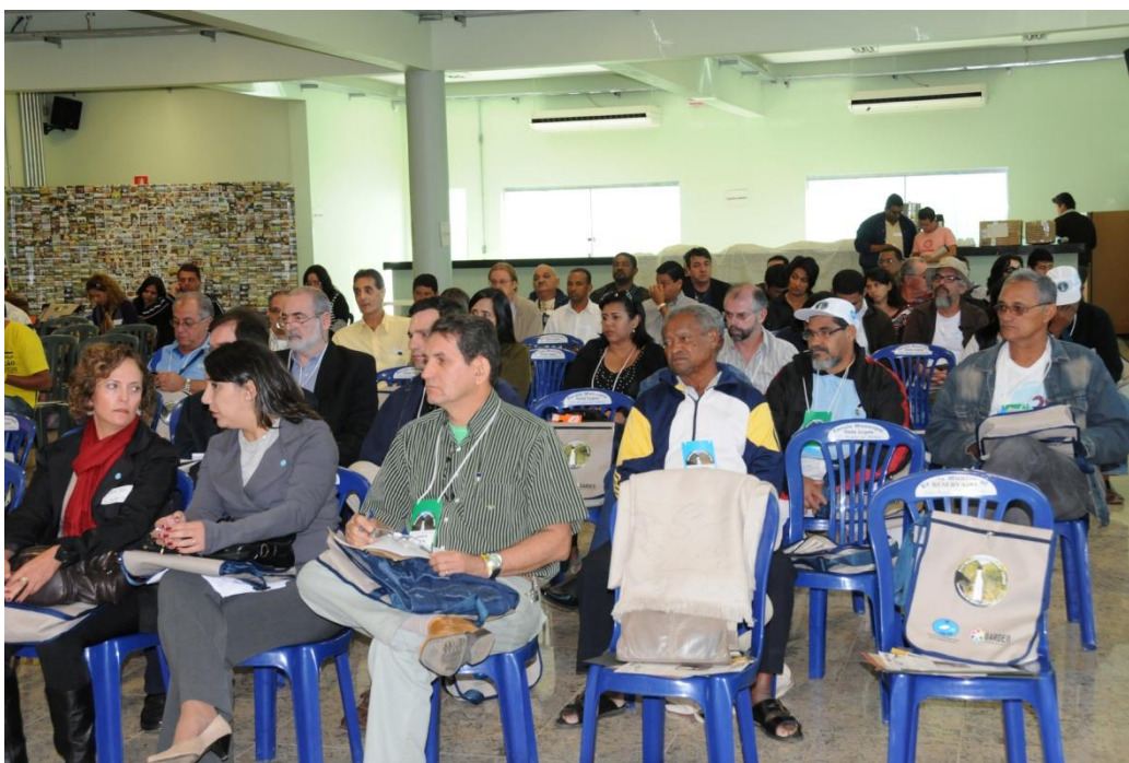
Figura 4 – Conselheiros presentes na XVII Reunião Plenária Ordinária de São Roque de Minas

Neste mesmo encontro, foi realizada a X Reunião Plenária Extraordinária, que tinha como pauta a eleição dos novos membros da Diretoria Colegiada do CBHSF para o período 2010-2013.