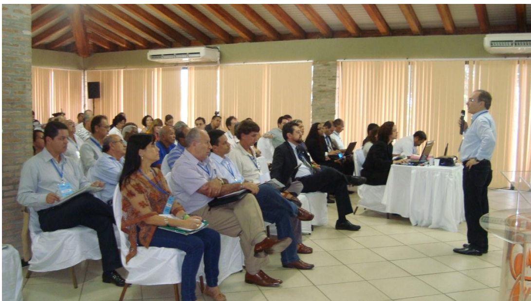
Figura 8 – Público presente às apresentações da X Reunião Plenária Extraordinária do CBHSF