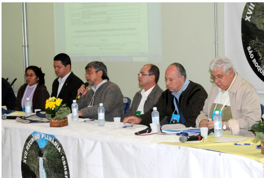
Figura 3 – Composição de mesa da XVII Reunião Plenária Ordinária de São Roque de Minas

As Figuras 3 e 4 ilustram, respectivamente, a composição dos membros que dirigiram os trabalhos iniciais de abertura do evento e a platéia de Conselheiros do CBHSF.