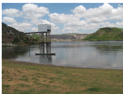
SF-01 – Rio São Francisco