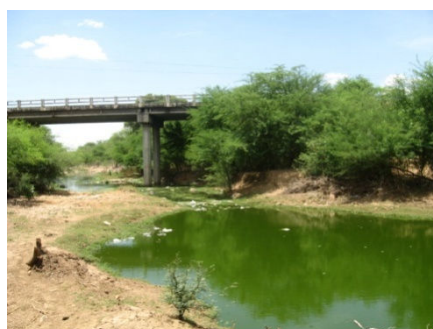
SF-02 – Rio Jacaré