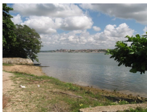
SF-05 – Rio São Francisco