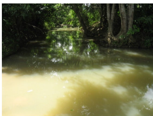
SF-04 – Riacho Pilões