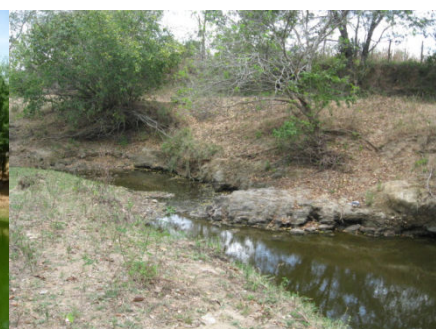
SF-03 – Riacho dos Cachorros