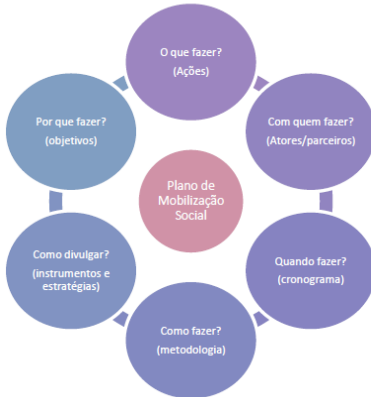
Figura 3 – Foco de atuação do Plano de Mobilização Social de um PMSB.