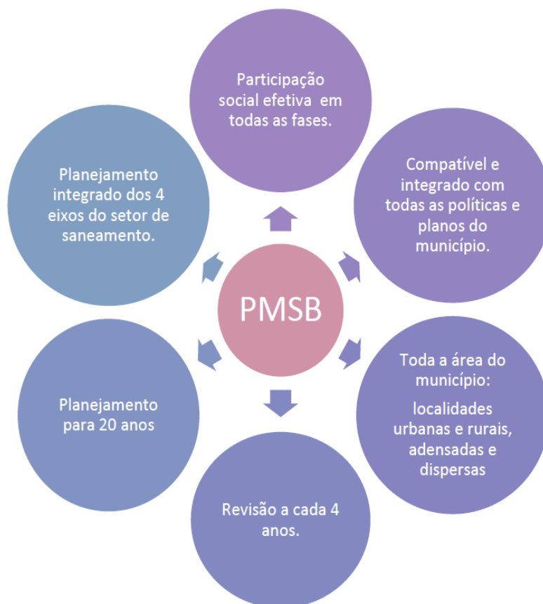
Figura 1 – Considerações gerais sobre a elaboração de PMSB

A Figura 1, extraída do “Termo de Referência para Elaboração de Planos Municipais de Saneamento Básico” da FUNASA, ilustra uma orientação de como a CONTRATADA deverá desenvolver seus trabalhos objetivando atender ao escopo deste TDR.