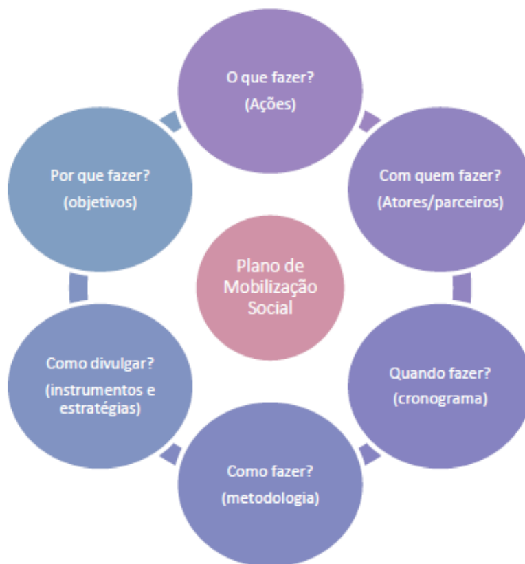
Figura 3 – Foco de atuação do Plano de Mobilização Social de um PMSB.

Na Figura 3 encontra-se ilustrado o foco de atuação do Plano de Mobilização Social de um PMSB: