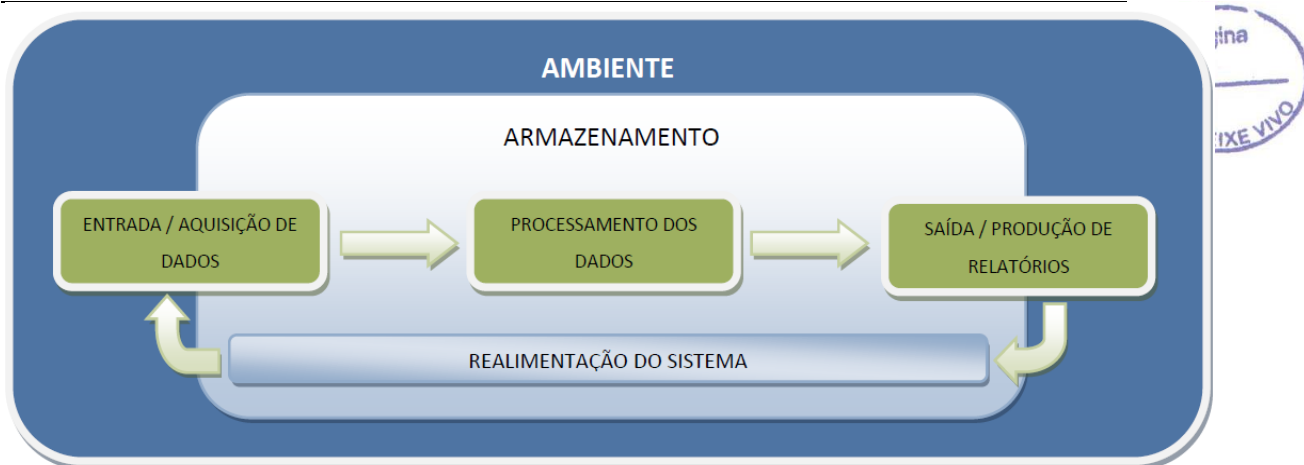
Figura 3 - Lógica de funcionamento esperada para o Sist. de Informações do PMSB