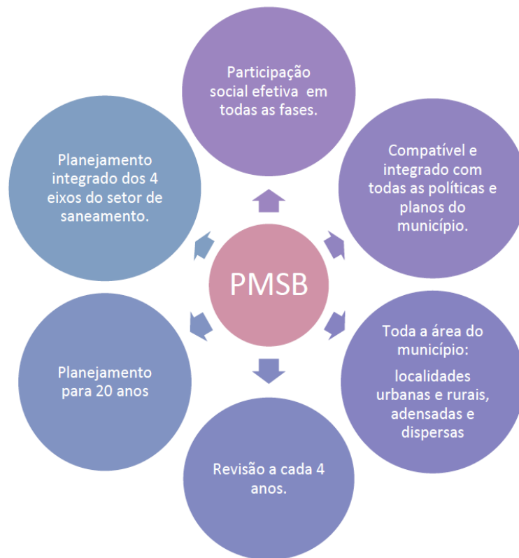
Figura 2 - Considerações gerais sobre a elaboração de PMSB

A Figura 2, extraída do “Termo de Referência para Elaboração de Planos Municipais de Saneamento Básico” da FUNASA, ilustra uma orientação de como a PREFEITURA MUNICIPAL deverá desenvolver seus trabalhos objetivando a aprovar o seu Plano Municipal de Saneamento Básico.