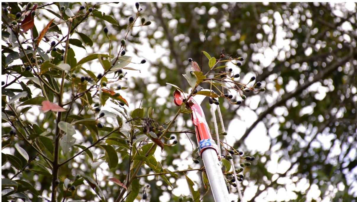
Figura 1: Coleta de sementes com auxílio de podador de haste longa.

não toleram a dessecação (recalcitrantes), foram semeadas imediatamente após o beneficiamento.