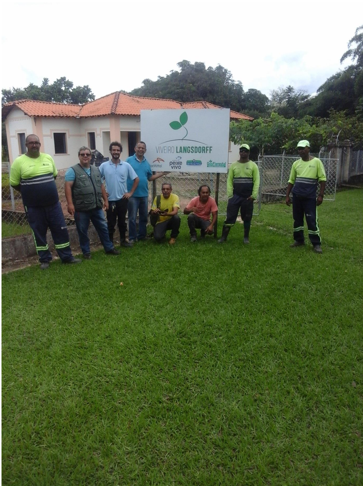
Figura 5: Equipe da Prefeitura Municipal de Contagem e o IEF.