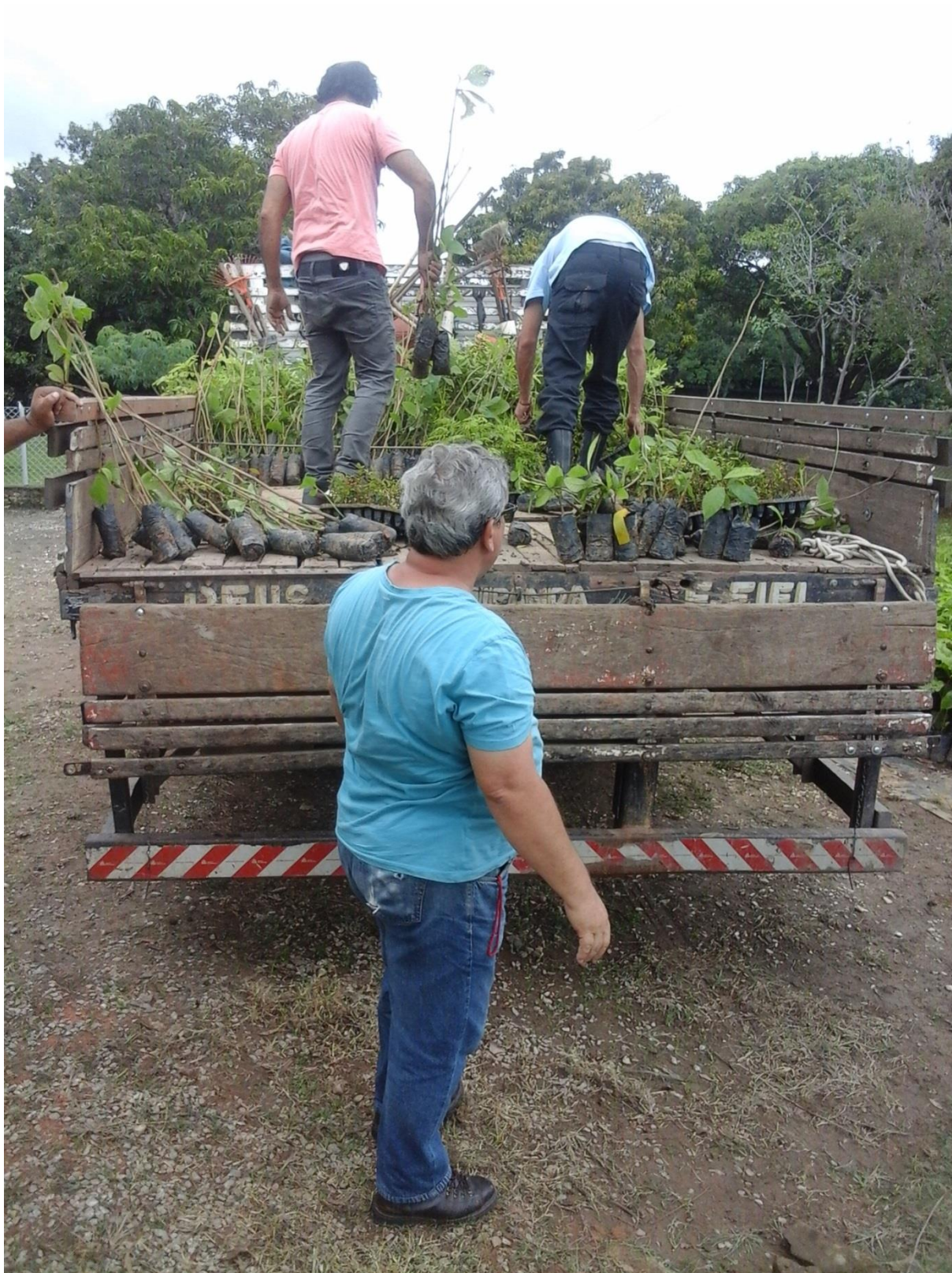
Figura 3: Carregamento das mudas no caminhão.