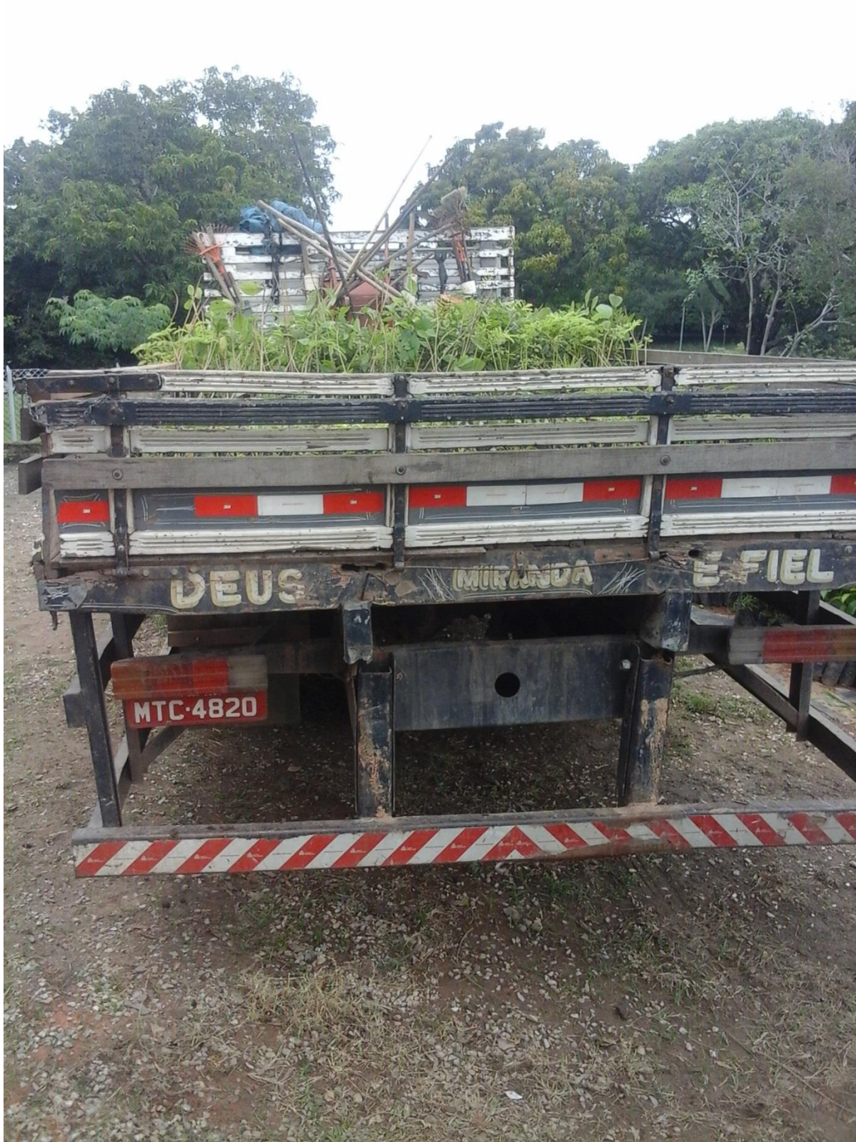
Figura 4: Carregamento das mudas concluído.