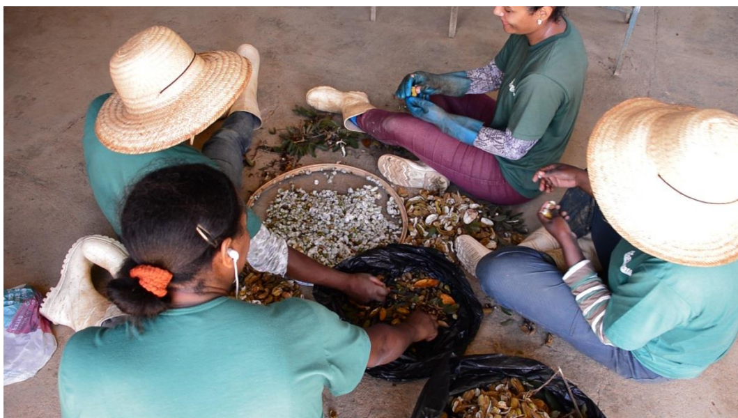
Figura 2: Beneficiamento de sementes pela equipe da GOS Florestal.